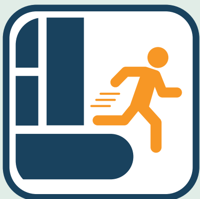
Afstapje snel verlaten