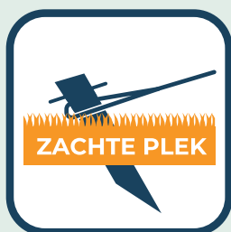
Veranker met haringen