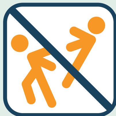
Niet duiken of wild spelen