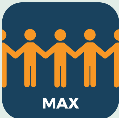
Check maximale aantal personen