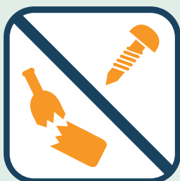
Geen scherpe voorwerpen