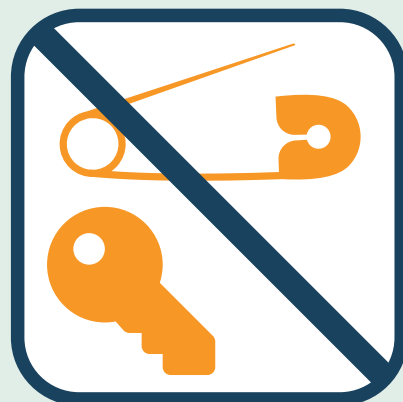
Geen scherpe voorwerpen