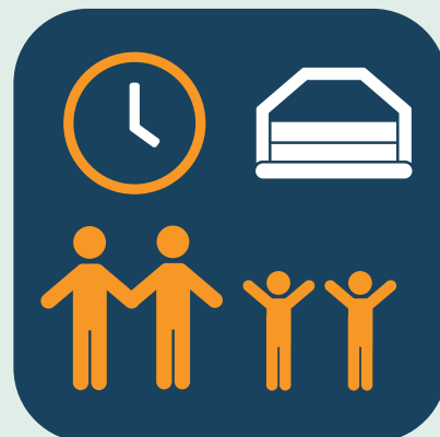
Grote en kleine kinderen wisselen af