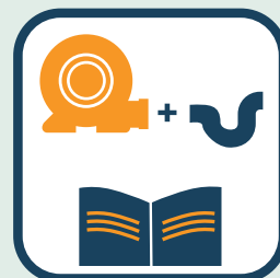
Sluit luchtslang aan