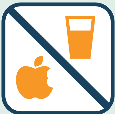
Geen eten of drinken