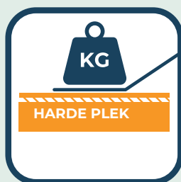
Veranker met gewichten