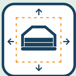
Genoeg ruimte rondom?