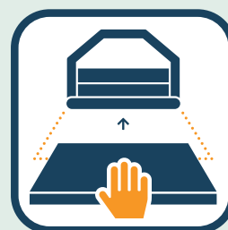
Plaats valdempend materiaal