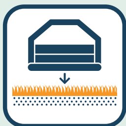
Ondergrond vlak en zacht?