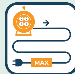
Rol stroomhaspel helemaal uit