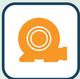
Gebruik bijbehorende blower