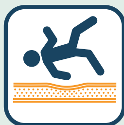
Valdempend materiaal nodig?