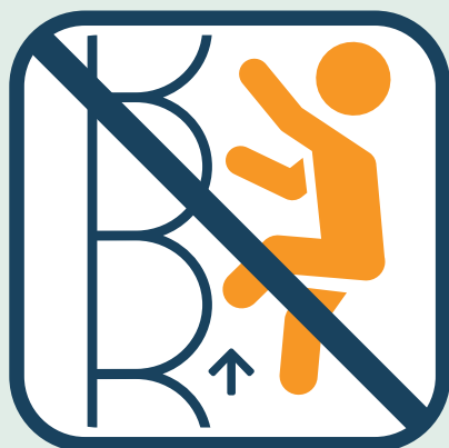
Niet op zijwanden klimmen